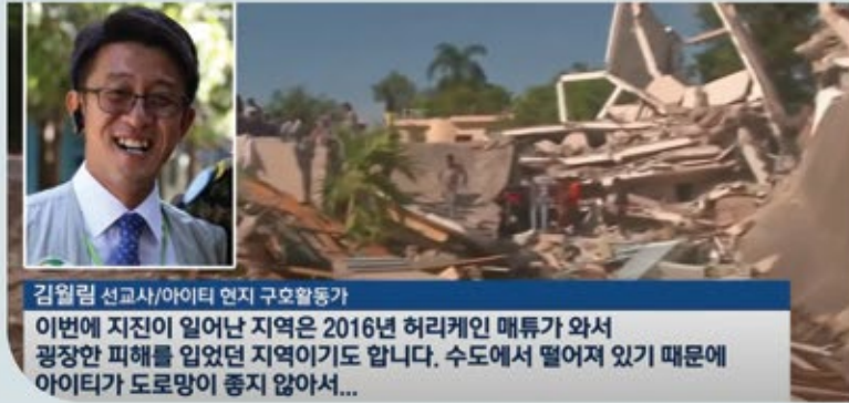
김일림 선교사/아이티 현지 구호활동가